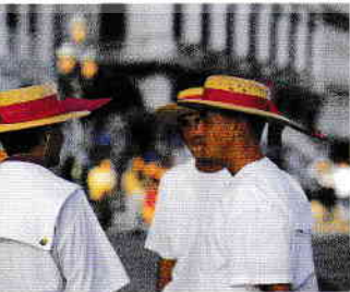
Gondolierii sunt ușor de identificat după pălăriile lor specifice

Text: Teresa Fisher; capitolul "Oaze de liniște" - P. Sterry