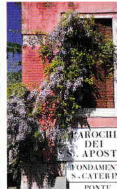
Glicină pe o clădire din districtul Cannaregio