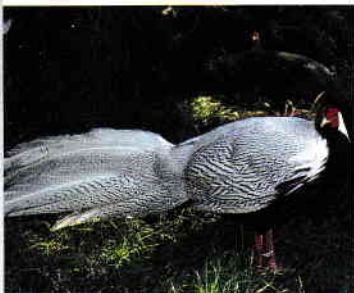
Păuniță din ostrovul San Francesco del Deserto